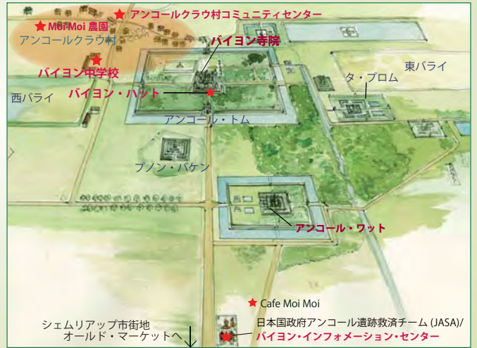
～ JST の主な活動エリア～