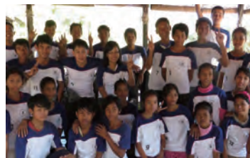
ការផ្គត់ផ្គង់ជំនួយពីប្រទេសជប៉ុន សកម្មភាពដ៏ធំនៅក្នុងភូមិ!

ក្នុងឆ្នាំ2012គឺចូលដល់ឆ្នាំទី3ដែលយើងបានបង្កើតកម្មវិធីអាហារថ្ងៃ ត្រង់នៅសាលា។ ជាធម្មតាក្មេងៗនៅក្នុងភូមិកម្របានបរិភោគអាហារ ដែលមានជីវជាតិបំប៉នដល់សុខភាពណាស់ ដូច្នោះJSTបានបង្កើតកម្មវិធី ជាបឋមជីវជាតិដែលមានគ្រឿងផ្សំចម្រុះដូចជាសាច់ជាមួយបន្លែដែលធ្វើ ឲ្យ ក្មេងៗក្នុងភូមិត្រេកអរខ្លាំងដោយទទួលបាននូវការញ៉ាំបឋមជីវជាតិ ថែមដោយសេរីនេះ។