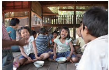
ស្ថាបតិកកុមារគឺជាស្ថាបតិកជំនួយក្នុងភូមិ