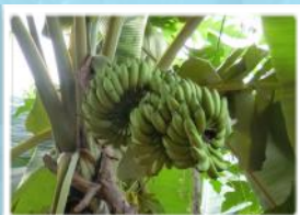
庭になっているバナナ