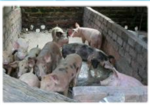
家で飼っている豚