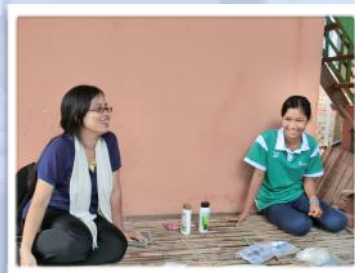
生活についてインタビューをしている様子

「私の家は、8人家族で、私は5人姉妹の3番目です。アルバイトはしていませんが、来年度から高校に通うつもりです。姉二人も高校まで出ており、一人は高校卒業後は服飾系の専門学校に通う予定です。飛び級で同じ学年の妹も、新学期からは同じ高校に通う予定です。父はアンコールトム内のお寺でお坊さんをしており、母は小学校で売店を出しながら米焼酎を作って売っています。生活で使用しているのは、井戸水です。家にある井戸から汲んだ水は、鉄のにおいがするため、水浴びや洗濯に使っています。料理に使う水や飲み水は、近所のアンコールクラウ小学校にある井戸から汲んできたものを使っています。こちらの水の方が浄化してあるためきれいで、安心して飲めるからです。将来の夢は、中学校の数学の先生になることです。」