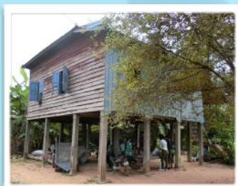
チェーン ネットさんの家