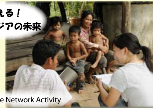
Interactive Network Activity

JST has implemented original tours to introduce Cambodian heritage and local village life. Interactive tours between Cambodian children and Japanese students are very popular. The profit through this original tours is used for educational program and other community activities of JST. From 2010 an internship program has started. University and after graduate students join JST activities in the village.