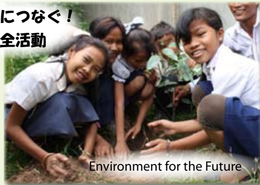
Environment for the Future