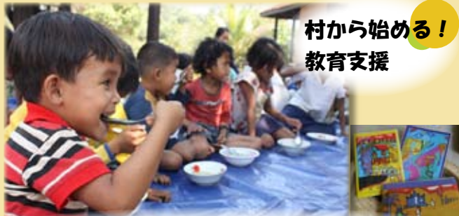
村から始める！ 教育支援

大人気の絵画教室。クレヨンや絵の具に触れたことがなかった子供たちも、今では立派に画用紙の中に独自の世界を表現しています。大胆な色づかいの力作がポストカードに！